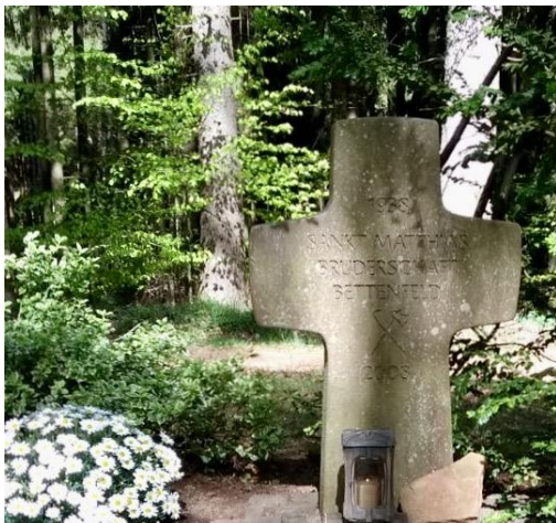
Bettenfelder Pilgerkreuz hinter Heidweiler.

Am 24. Februar feiern wir das Fest des hl. Matthias. Die Bruderschaft gedenkt in einer hl. Messe allen Lebenden und Verstorbenen der Bruderschaft Bettenfeld, sowie den Pilgerinnen und Pilgern. Den genauen Termin der hl. Messe bitte dem aktuellen Pfarrbrief entnehmen. Da keine Mitgliedsbeiträge mehr erhoben werden, können gerne freiwillige Spenden abgegeben werden. Für die Bruderschaft Bettenfeld Werner Steines (Brudermeister)