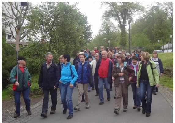
Wallfahrtsgruppe im Jahr 2012