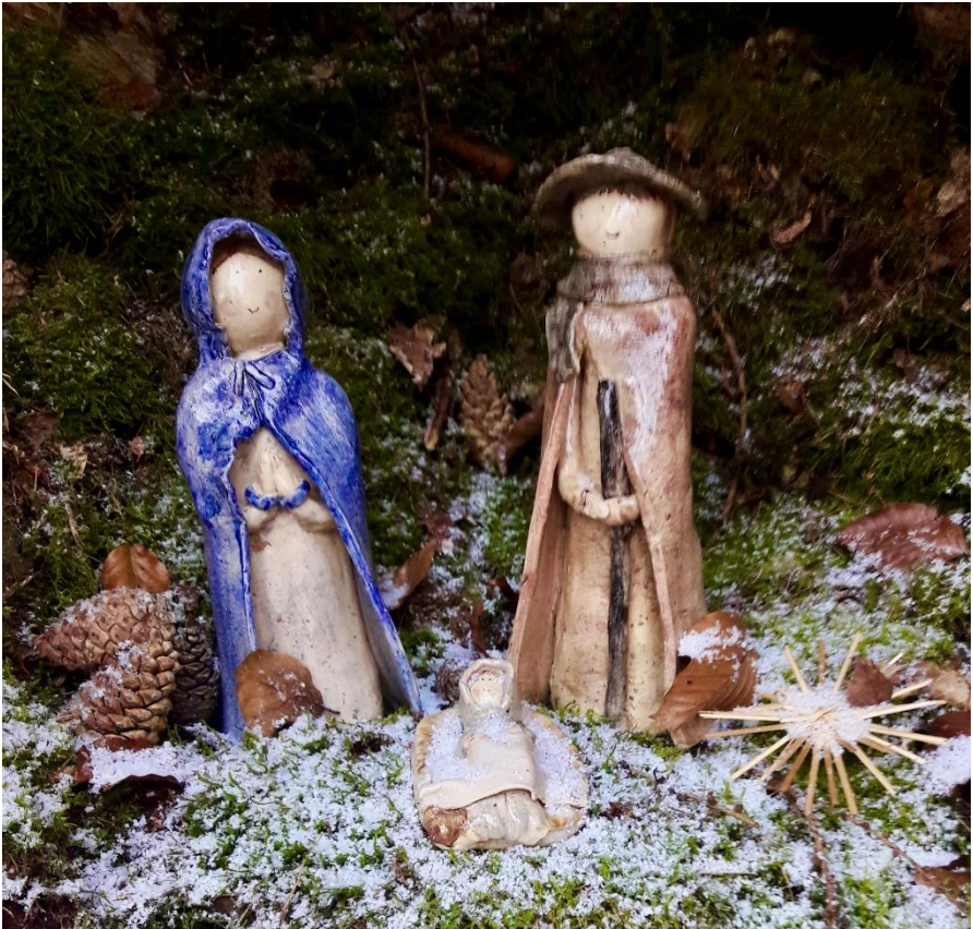
Weihnachtskrippe im Waldkindergarten Niederöfflingen